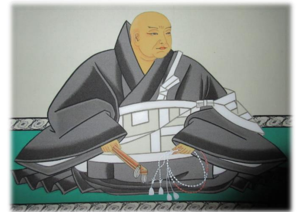
緯如上人（本願寺第五代）

本願寺第五代を継承しまもなく北陸に赴き、現在の井波別院瑞泉寺を建立し、北陸地方を中心に教化活動を行った。 中国皇帝からの国書を解読し、天皇より周円上人の称号を与えられる。