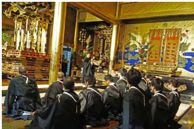
上: 昨年の研修会の様子