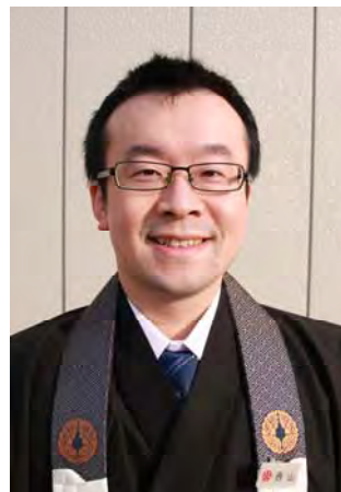
三条教務所駐在教導