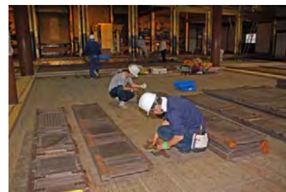
上: 取り外された唐戸