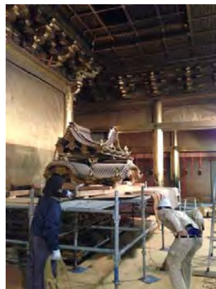
左: 引き降ろされる宮殿