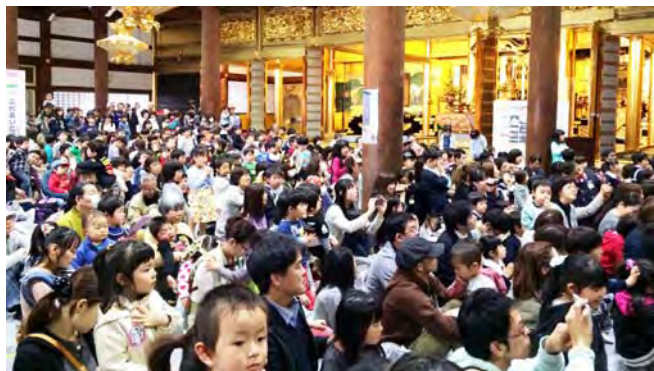
(写真上)本堂内のショーに集る参加者

2015年4月4日(土)から5日(日)まで、三条別院において子ども御遠忌を開催しました。