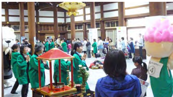
(写真上)しらん音頭をリードする坊守会の皆さんと参加者