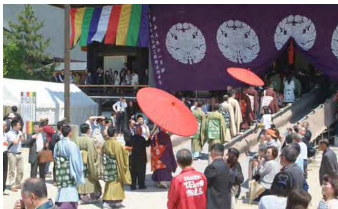
入堂する庭儀列(5月24日結願日中)